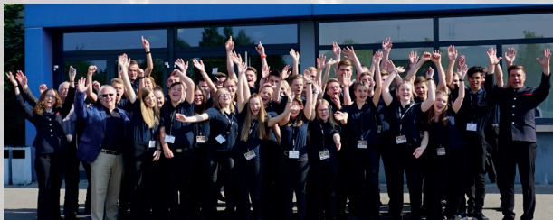
Die Junge Harmonie als Preisträger beim Wettbewerb „Bw-Musix“ in Ballingen

Der Musikzug ist seit 1882 das musikalische Aushängeschild der Stadt Olpe und leistet als gemeinnütziger Verein im Rahmen der Feuerwehr vielfältige gesellschaftlich und kulturell wertvolle Arbeit. Ein besonderer Fokus liegt dabei auf der Förderung junger Nachwuchsmusiker.