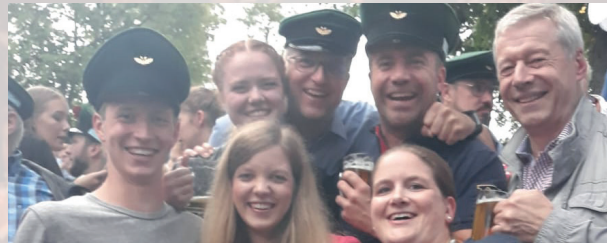
Fäßchentrinken auf dem Olper Schützenfest

Unsere Konzerte erfreuen sich stets großer Beliebtheit und Karten dafür sind schnell vergriffen. Als Mitglied haben Sie die Möglichkeit, Karten bereits vor dem offiziellen Vorverkaufsstart zu bestellen.