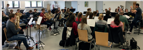
Jahresauftaktprobe mit anschließendem gemütlichem Beisammensein

Genauso wie der Musikzug als Festmusik viele Schützenfeste musikalisch gestaltet, feiern die Musiker selbst ihr eigenes Schützenfest auf dem Ümmerich und laden alle Mitglieder am Samstagabend zum traditionellen Fäßchentrinken ein.