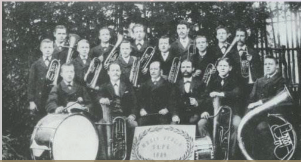
Unterstützen Sie Tradition seit 1882

Der Musikzug ist seit 1882 das musikalische Aushängeschild der Stadt Olpe und leistet als gemeinnütziger Verein im Rahmen der Feuerwehr vielfältige gesellschaftlich und kulturell wertvolle Arbeit. Ein besonderer Fokus liegt dabei auf der Förderung junger Nachwuchsmusiker.